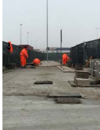
2. rifacimento marciapiedi e aree pedonali