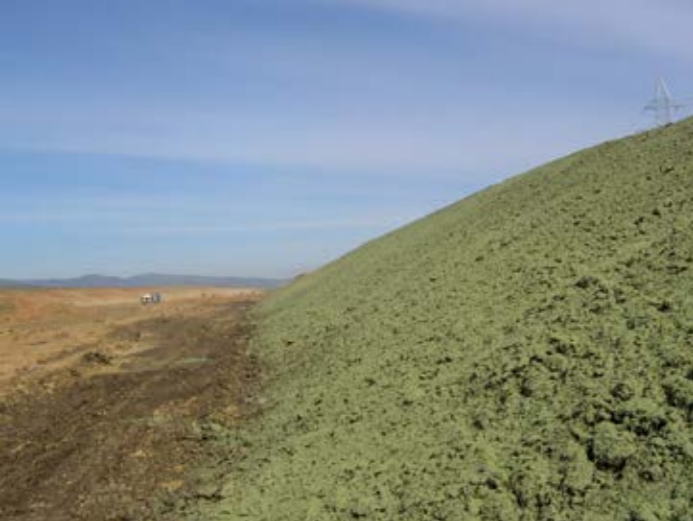
1. idrosemine a spessore con tecnica "mulch" su versanti soggetti a movimenti franosi superficiali