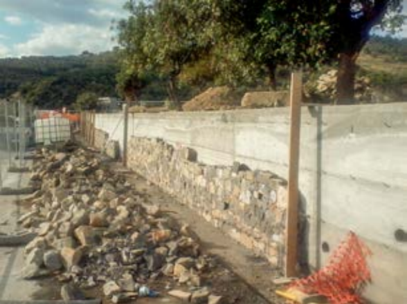
1. realizzazione di muretti in cls rivestiti con pietra locale