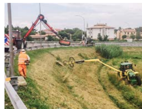
7. sfalci meccanizzati su versanti con profondità fino a 18 mt.