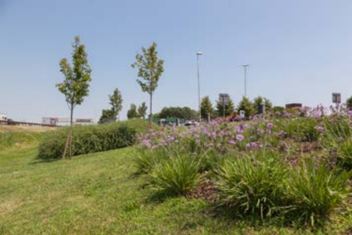
1. manutenzione delle aree di servizio