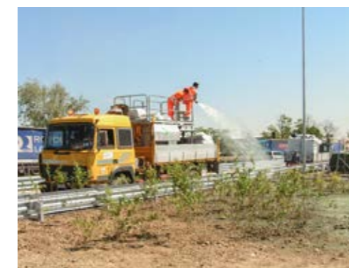
8. idrosemine meccaniche a pressione