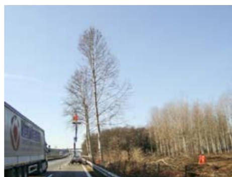
6. abbattimenti e potature di alberature pericolanti in ambito stradale ed autostradale

Le nostre realizzazioni hanno riguardato i più diversi ambiti infrastrutturali, occupandoci principalmente della realizzazione di opere ambientali finalizzate al reinserimento delle infrastrutture nell'ecosistema locale.