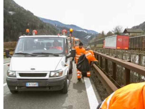
3. raccolta di rifiuti lungo le autostrade