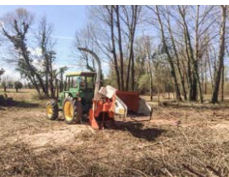
4. disboscamenti con triturazione sul posto del materiale legnoso

Gli impianti a verde vengono progettati e poi realizzati tenendo conto dei fattori di manutenzione connessi agli impianti stessi; pertanto la scelta dei materiali e delle piante viene fatta con estrema attenzione e scrupolosità, al fine di ottimizzare le scelte che si rifletteranno, inevitabilmente, sugli oneri di manutenzione futuri.