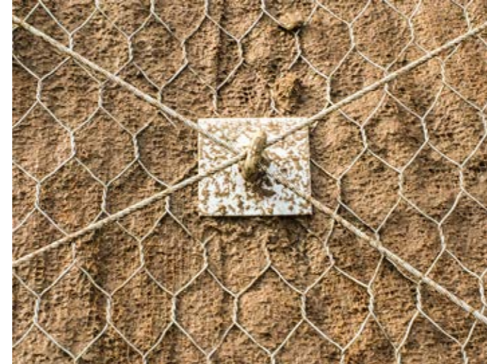
3. esecuzione di consolidamenti superficiali con abbinamenti di geosintetici, biostuoie e reti paramassi