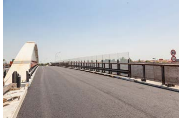
2. posa in opera di barriere guard rail