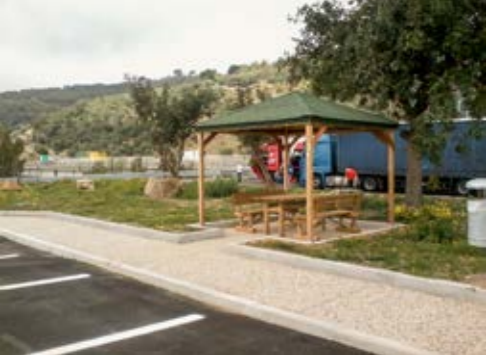
1. posa di arredo urbano