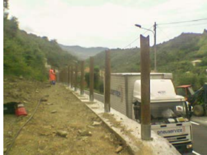
2. realizzazione di percorsi naturalistici