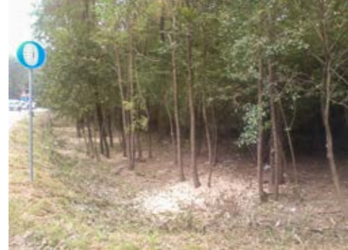
2. disboscamenti selettivi