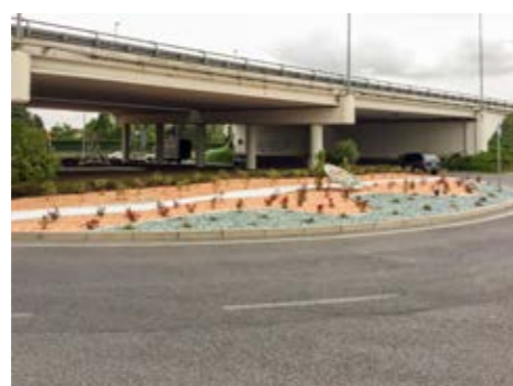
5. realizzazione di aiuole verdi