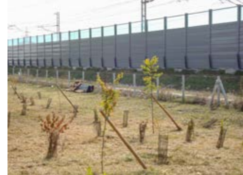
3. opere di compensazione ambientale piantagioni essenze forestali